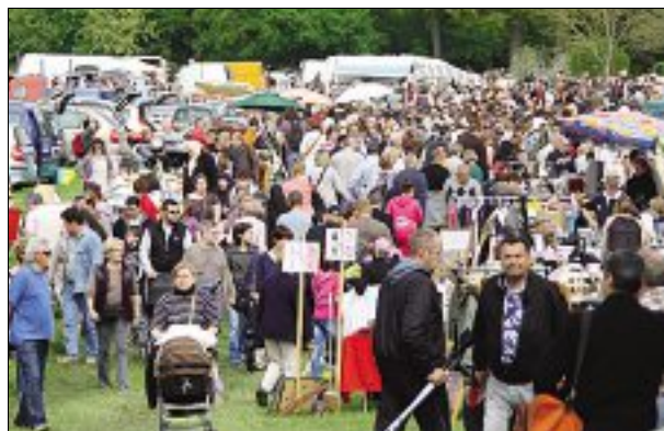
STANDS. L'an dernier, la foule était au rendez-vous.

Cette seizième édition ouvre ses portes dès 6 heures, et les fermera à 18 heures. Une trentaine de bénévoles sont à pied d'œuvre durant toute la journée. Les organisateurs attendent plus 250 expo-