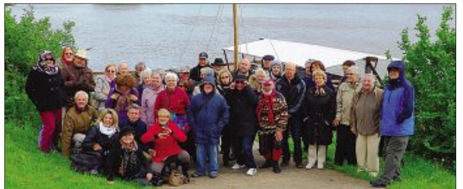
DÉTENTE. Les choristes du chœur Bortnianski, venus de toute l'Europe, ont pris l'air, hier matin.